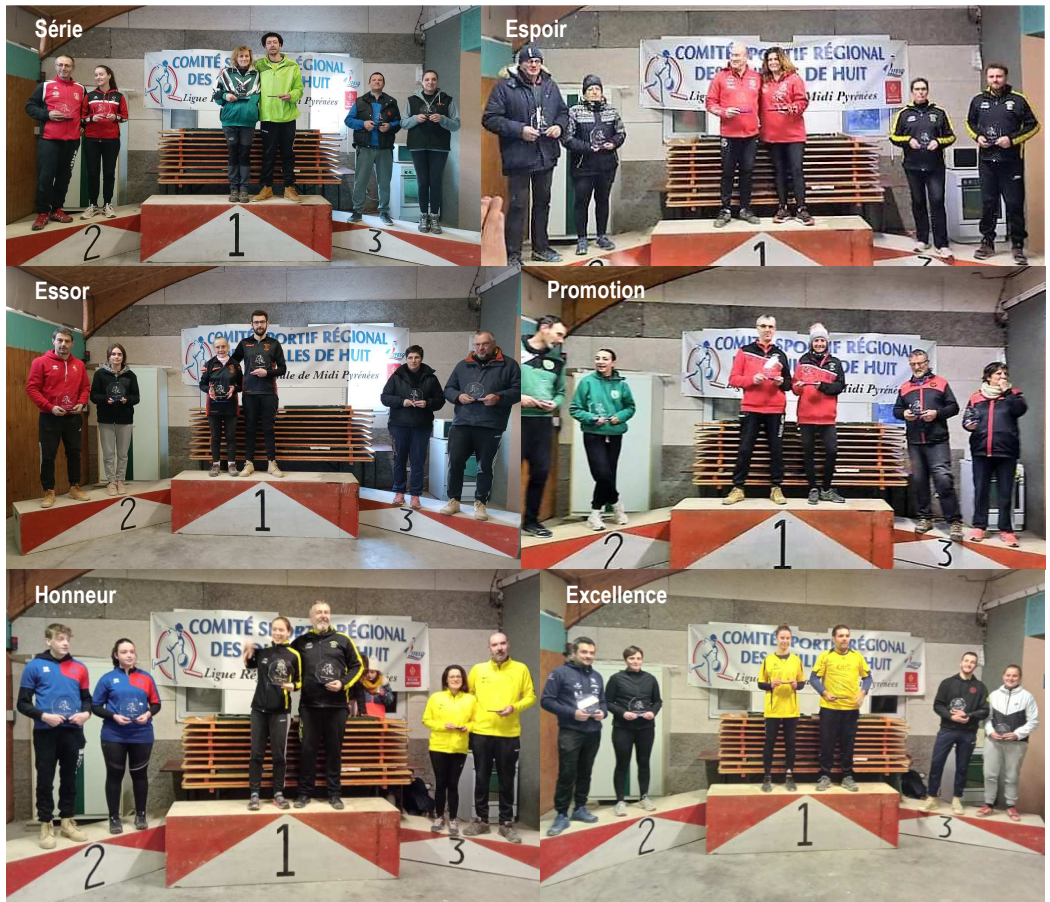
Les récompensés du Challenge Doublettes mixtes 2023.